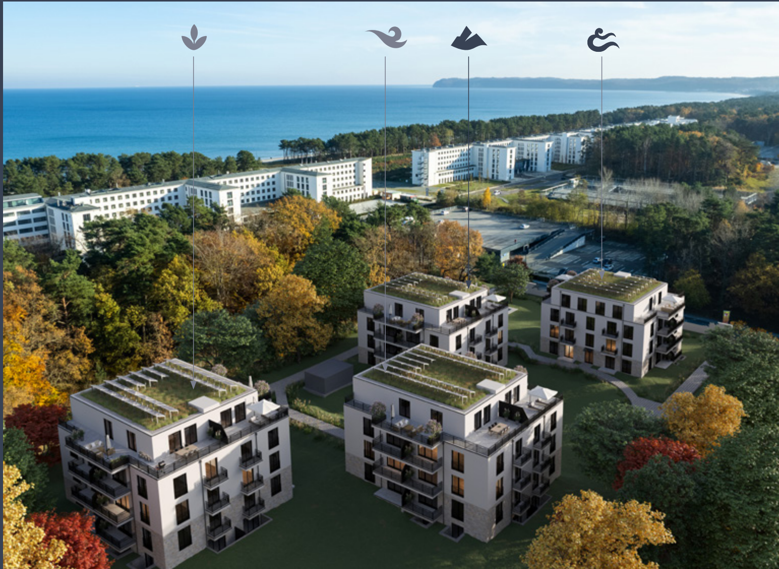
Abbildung aus Sicht des Illustrators